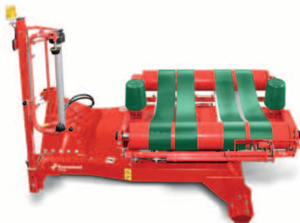
Kverneland 7710 C je ideální řešení pro stacionární provoz.