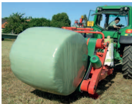
Nízká vykládka pro rychlejší a jemnější složení.